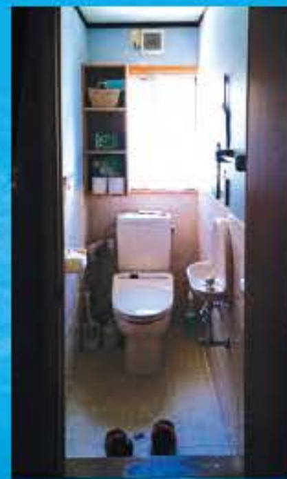
（参考）リフォーム代・デザイン料込 35万円【税別】