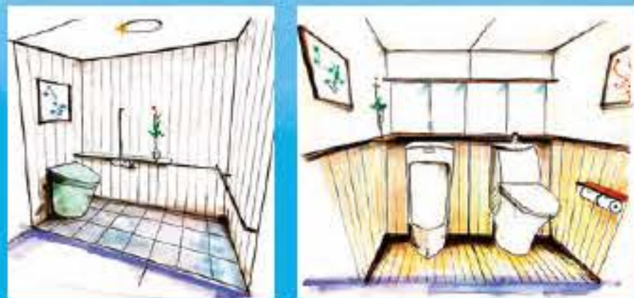
（デザインイメージのサンプル）

そこで、理想のトイレの形や色、不便なところ等を詳しく伺いし、「清掃しやすいトイレ」をコンセプトにしたデザインを協力会社へお願いし、リフォームをご提案しました。 ああしたい、こうしたいというアイデア