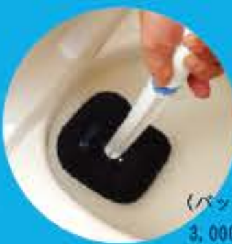
（パソコンバー） 3,000円【税別】

力を入れてグッと引きます。動作が大きすぎると水の跳ね返りがあるので、注意します。