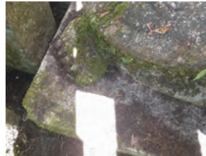
↑墓石についたコケ(3代墓所)