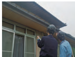
↑状況確認(空き家巡回サービス)