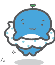
雲海くじらの うんぺいくん

時間はとられますが、新しい製品の知識をみんなで勉強することも大切な仕事のひとつなのです。