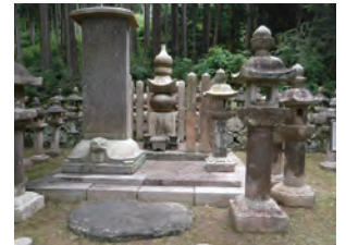
墓石周りの雑草は、丁寧に手作業で抜いていきます。