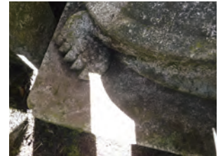
墓石のコケも傷つけないように手できれいに落とします。