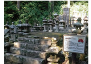
背の高い草木もしっかり取り除き、安心して参拜できるお墓へ。