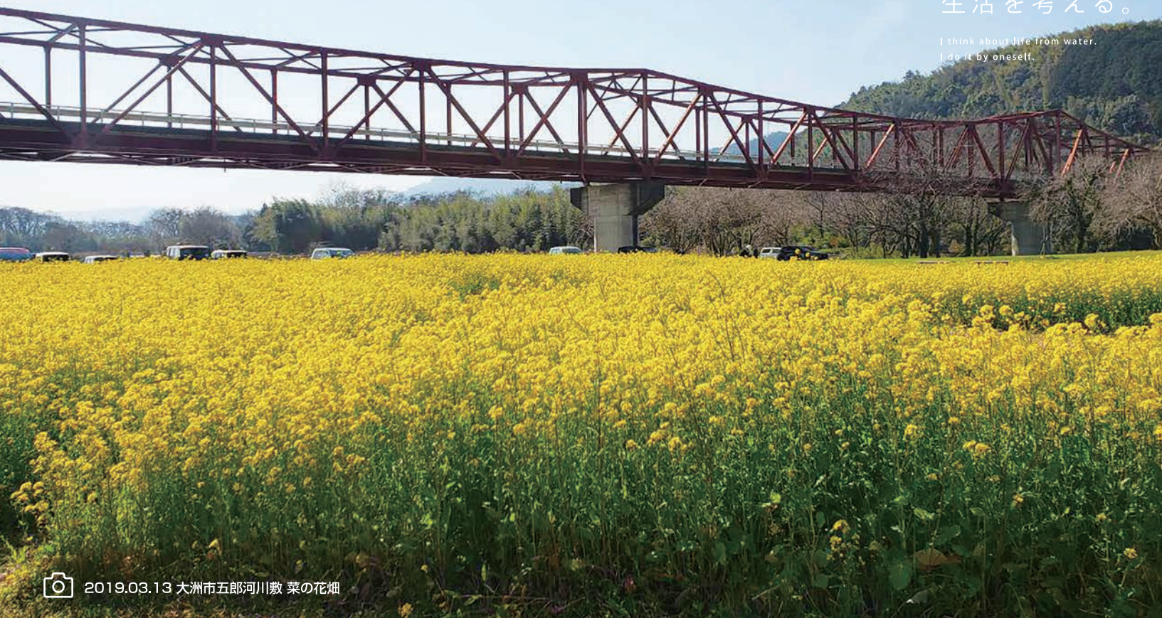
📷 2019.03.13 大洲市五郎河川敷 菜の花畑